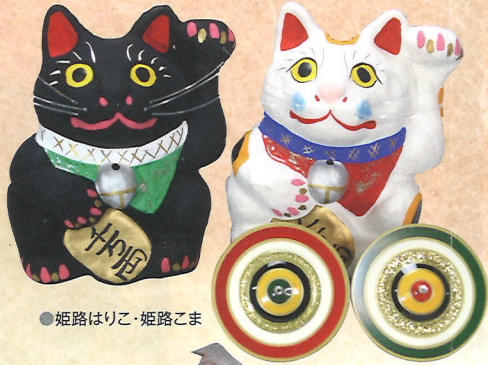
●姫路はりこ・姫路こま